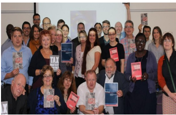
(Εργαζόμενοι στη ΔΔ από σεμινάριο της EPSU για την φορολογική δικαιοσύνη.)

Κείμενο της EPSU στο πλαίσιο του ευρωπαϊκού διαλόγου επί των προτάσεων διαφάνειας της φορολόγησης των πολυεθνικών. "Η BusinessEurope (η ευρωπαϊκή οργάνωση που εκπροσωπεί τις βιομηχανικές και εργοδοτικές ενώσεις από 34 χώρες) εμμένει στη θέση της – την οποία έχει διατυπώσει σε παλαιότερη επιστολή της προς την επιτροπή οικονομικών υποθέσεων του Ευρωκοινοβουλίου και πρόσφατα την έθεσε εκ νέου σε ευρωπαϊκή κοινοβουλευτική ακρόαση – ότι η δημοσιοποίηση των εκθέσεων ανά χώρα, θα υπονομεύσει τις εθνικές φορολογικές αρχές.