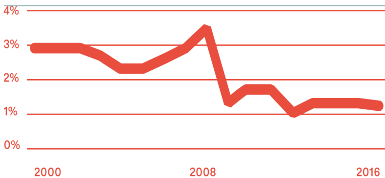
Μεταβολή των αμοιβών 2000-2016 κατά εργαζόμενο/η στην Ευρώπη

Η επέκταση των συλλογικών διαπραγματεύσεων, η ενδυνάμωση των συνδικάτων η στήριξη των κλαδικών διαπραγματεύσεων, η προστασία των προσωρινά απασχολούμενων και η κατάργηση των συμβάσεων μηδενικών ωρών είναι προαπαιτούμενα για τη αύξηση των μισθών