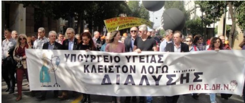
Στιγμιότυπα από την κινητοποίηση της ΠΟΕΔΗΝ 18/2

χρηματοδότηση προς το Σύστημα και τα λειτουργικά έξοδα διαβιβάζονται στους πολίτες με άμεσα ή έμμεσα χαράτσια (αγορά υπηρεσιών, επιβολή δημοτικών τελών κ.α). Επιδιώκουν να καταστήσουν το Σύστημα ΑΥΤΟΧΡΗΜΑΤΟΔΟΤΟΥΜΕΝΟ με την εμπλοκή των φορέων της Τοπικής Αυτοδιοίκησης, καθώς επίσης την εμπλοκή μη