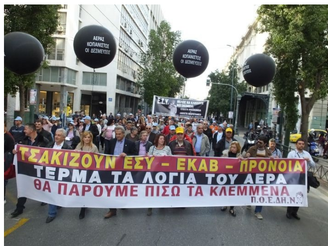
Στιγμιότυπο από το μπλοκ της ΠΟΕΔΗΝ στην 24ΩΡΗ Απεργία στις 2 -12-2015

Ταυτόχρονα να υπάρξει περαιτέρω ελαστικοποίηση των εργασιακών σχέσεων (μπλοκάκια, συνεργεία, εκπαιδευόμενοι, ορισμένου χρόνου, ΕΣΠΑ κλπ)».