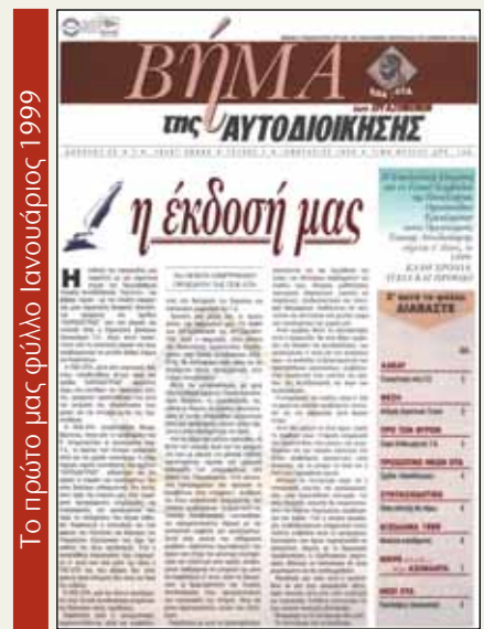
Το πρώτο μας φύλλο Ιανουάριος 1999

100 τεύχη: Στην υπηρεσία των εργαζομένων των Ο.Τ.Α.