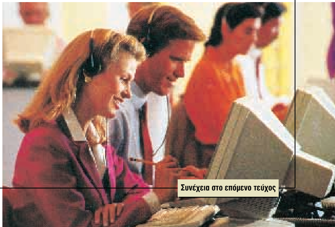
Συνέχεια στο επόμενο τεύχος