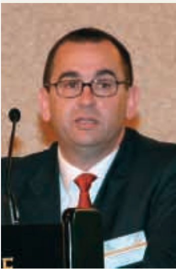
Αγαπητοί φίλοι προσκεκλημένοι,