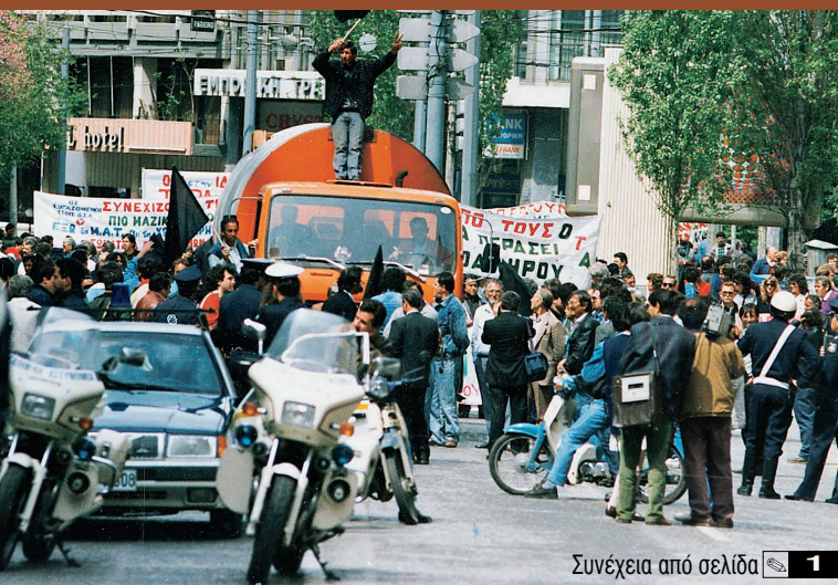
Συνέχεια από σελίδα 1

ΜΕΤΑ ΤΙΣ ΑΠΕΡΓΙΑΚΕΣ ΚΙΝΗΤΟΠΟΙΗΣΕΙΣ ΤΩΝ ΕΡΓΑΖΟΜΕΝΩΝ ΤΟΥ ΚΛΑΔΟΥ ΜΑΣ