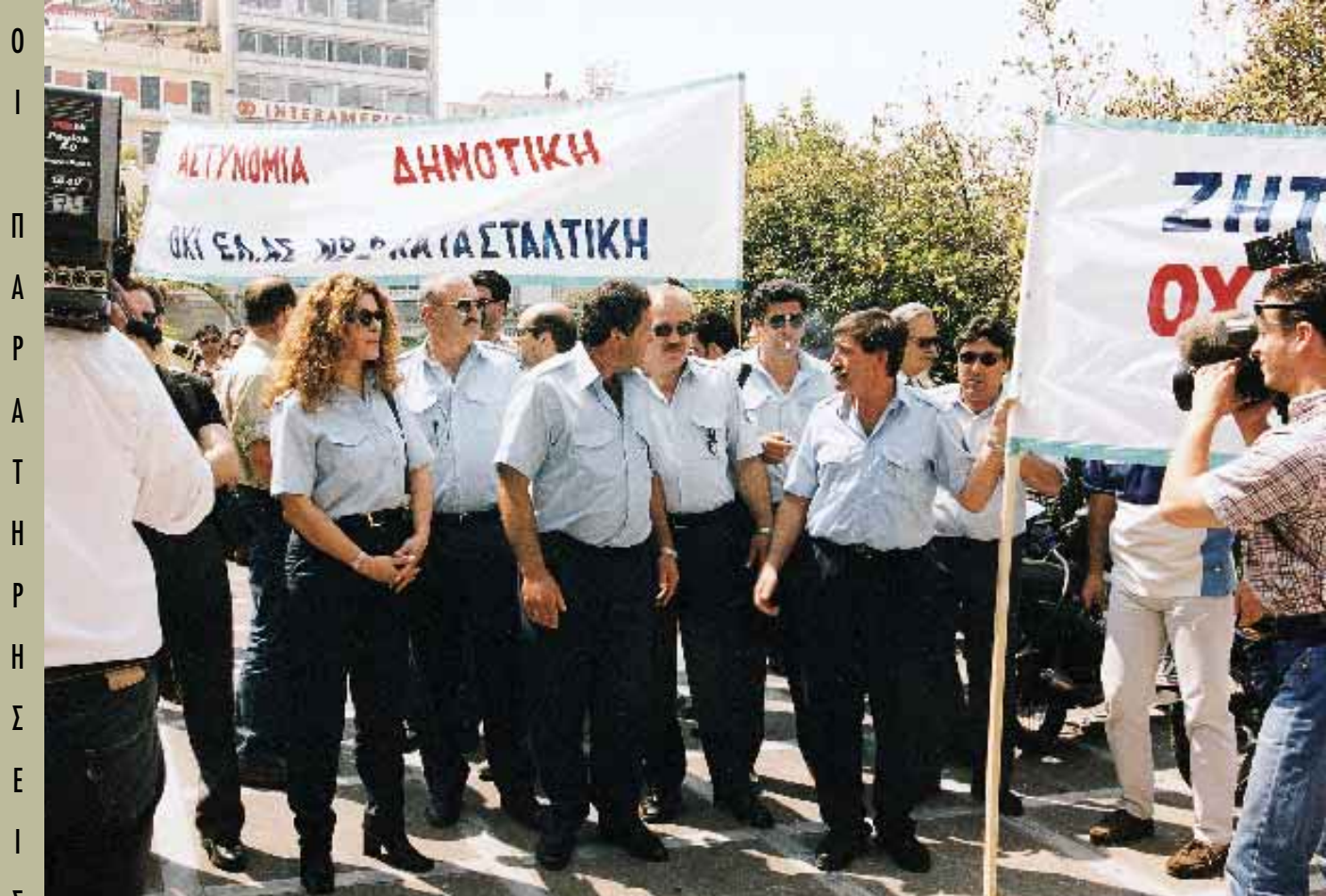
τ η ς Π. Ο. Ε. - Ο. Τ. Α.

Στη συνέχεια, το λόγο έλαβαν ο γενικός γραμματέας Δημόσιας Διοίκησης του Καναδά, Ζαν Γκι Φλερί, ο οποίος μίλησε για θέματα διοίκησης στη χώρα του, καθώς και στελέχη του υπουργείου Εσωτερικών που αναφέρθηκαν σε θέματα αποτελεσματικότητας της Δημόσιας Διοίκησης.