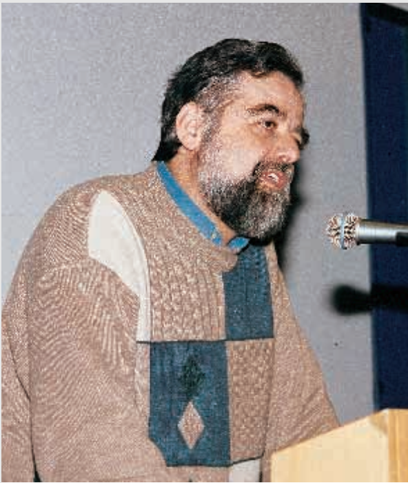
Αγαπητές φίλες και φίλοι εκ μέρους του Κομμουνιστικού Κόμματος Ελλάδας, ευχαριστούμε για την πρόσκληση στο 31ο Συνέδριό σας.

Αγαπητοί φίλοι και συνάδελφοι το Συνέδριό αυτό γίνεται σε μία εποχή κρίσιμη, σε μία εποχή που δεχόμαστε μία συνολική επίθεση όλοι οι εργαζόμενοι, η Τοπική Αυτοδιοίκηση δέχονται μία συνολική, ολομέτωπη επίθεση από την πλευρά του μετώπου, κυβέρνησης – κεφαλαίου – Ευρωπαϊκής Ενωσης.