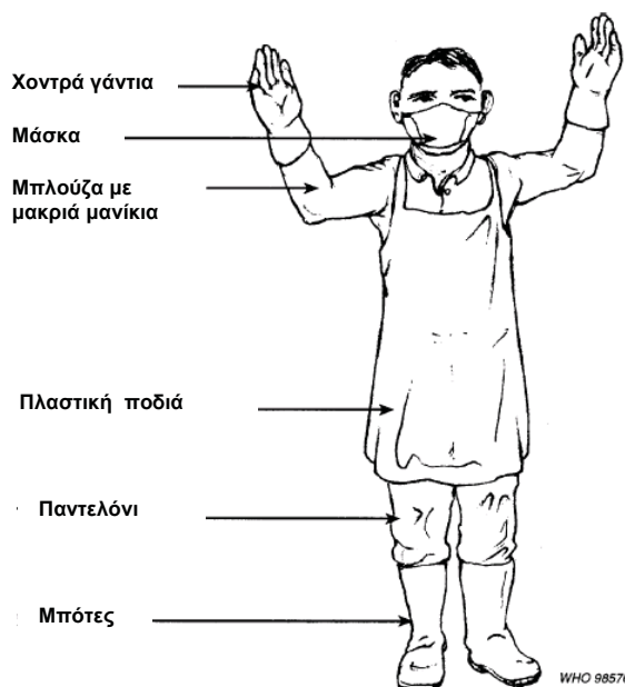
Σχήμα 5: Συνιστώμενη ενδυμασία κατά τη μεταφορά ΕΑΥΜ

Παρακάτω παρουσιάζεται η συνιστώμενη ενδυμασία κατά τη μεταφορά ΕΑΥΜ.