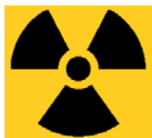
Σχήμα 4 : Διεθνές σύμβολο μολυσματικού και ραδιενεργού χαρακτήρα

Τα κατάλληλα αποθηκευτικά μέσα θα πρέπει να είναι διαθέσιμα στα αντίστοιχα σημεία παραγωγής των αποβλήτων. Ειδικές οδηγίες που αφορούν την κατηγοριοποίηση, διαλογή και πλήρωση των αποθηκευτικών μέσων θα πρέπει να είναι αναρτημένες σε όλα τα σημεία παραγωγής και συλλογής των αποβλήτων.