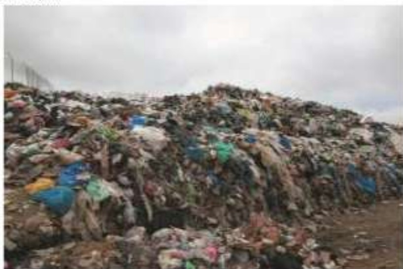
Χώρος δεματοποίησης αποβλήτων (Μάρτιος 2017)

τείται, είτε η κατασκευή ΧΥΤΥ. Στόχος είναι να αποφευχθεί η ανεξέλεγκτη εγκατάλειψη και απόρριψη των αποβλήτων και να κλείσουν και να αποκατασταθούν οι υφιστάμενοι ΧΑΔΑ. Προβλέπονται, επίσης, συνοδά έργα (ΣΜΑ κ.λπ), όπως και έργα για τη μεταβατική διαχείριση. Στους υφιστάμενους ΠΕΣΔΑ δεν προβλέπεται η εγκατάσταση μονάδας αποτέφρωσης των στερεών αποβλήτων, καθώς η μέθοδος αυτή αντίκειται στην ιεράρχηση της διαχείρισης των στερεών αποβλήτων και στους στόχους που έχουν τεθεί από το υφιστάμενο ΕΣΔΑ. Επίσης, σύμφωνα με τις στρατηγικές διαχείρισης αποβλήτων του ΕΣΔΑ, σημείο 5, «... Τεχνικές που παράγουν RDF/SRF δεν ενδείκνυνται για την επεξεργασία των απορριμμάτων καθώς απομακρύνουν υλικά που πρέπει να οδεύουν προς ανακύκλωση...».