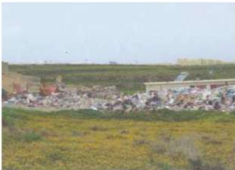
Εξωτερικός χώρος ΚΔΑΥ (Φεβρουάριος 2019)

Τα Κέντρα Διαλογής Ανακυκλώσιμων Υλικών (ΚΔΑΥ) αποτελούν ένα ιδιαίτερα σημαντικό κρίκο στην αλυσίδα της ολοκληρωμένης διαχείρισης αποβλήτων, αναγκαίο για την ενίσχυση της ανακύκλωσης. Ωστόσο, ο ΣτΠ - από την εξέταση σημαντικού αριθμού υποθέσεων - διαπίστωσε ότι οι εν λόγω μονάδες αν και φέρονται ως «φιλοπεριβαλλοντικές» και διέθεταν τις προβλεπόμενες άδειες και εγκρίσεις, ωστόσο λειτουργούσαν καθ' υπέρβαση των όρων αυτών και χωρίς να τηρούν τους εγκεκριμένους περιβαλλοντικούς όρους, με αποτέλεσμα τη ρύπανση του περιβάλλοντος και την πρόκληση συνεπειών στη δημόσια υγεία.