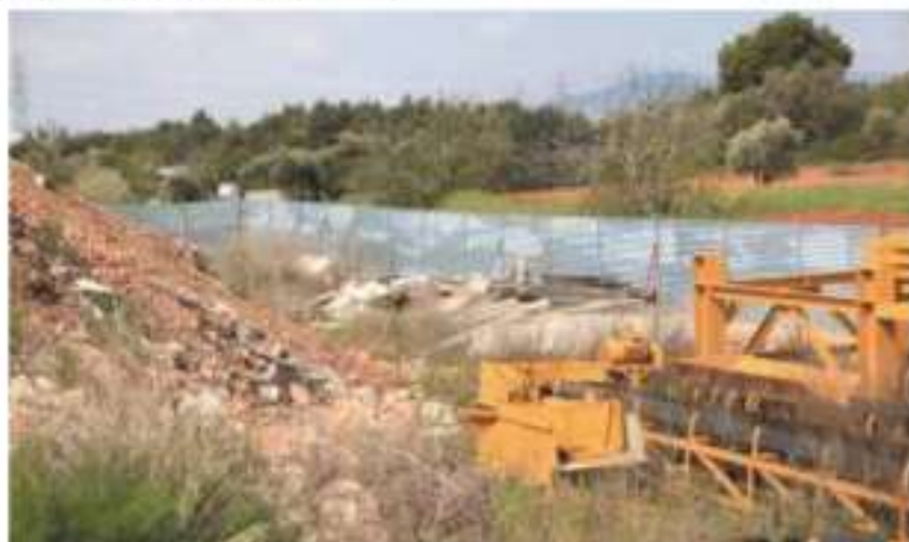
Χώρος αποθήκευσης και επεξεργασίας ΑΕΚΚ εντός εργοταξίου δημοσίου έργου (Απρίλιος 2019)