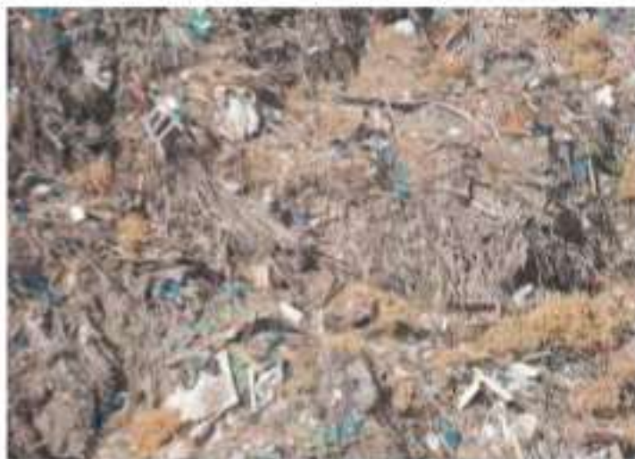
ΧΑΔΑ στη θέση Λατζιμάς Δήμου Ρεθύμνης (Οκτώβρης 2018)

επανελημμένα επισημάνει ο Συνήγορος του Πολίτη, οι δήμοι φέρουν την ευθύνη της καθαριότητας των κοινοχρήστων χώρων 26 και της εξάλειψης της ανεξέλεγκτης διάθεσης των αποβλήτων 27 , ενώ η ανεξέλεγκτη απόρριψη κλαδιών και λοιπών πράσινων αποβλήτων σε κοινόχρηστους χώρους, ανεξάρτητα από τον υπαίτιο, καθιστά τον Δήμο, ο οποίος είναι αρμόδιος για τη διαχείριση των στερεών αποβλήτων της εδαφικής του περιφέρειας, υπεύθυνο για την υποβάθμιση του περιβάλλοντος κατά τους ορισμούς του άρθρου 2 του ν. 1650/1986, όπως ισχύει, λόγω της μη ορθής αποκομιδής των φυτικών αποβλήτων.