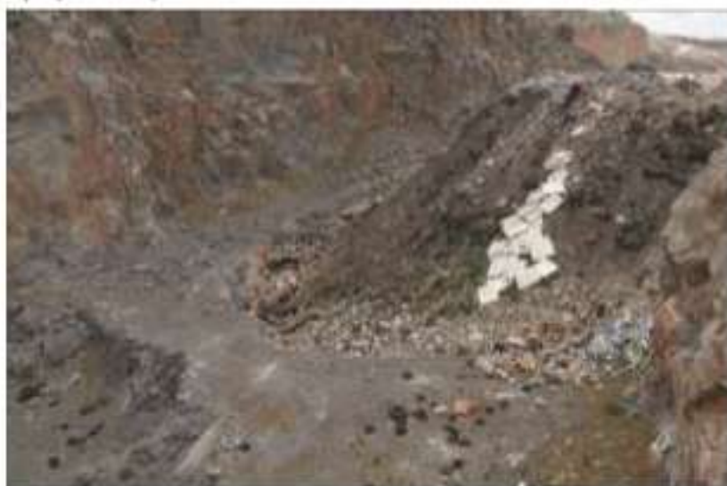
ΧΑΔΑ στη θέση Λατζμάς Δήμου Ρεθύμνης (Μάρτιος 2016)