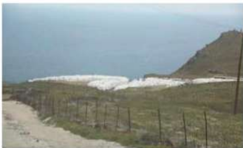
Χώρος δεματοποίησης αποβλήτων Τήνου (Μάρτιος 2017)