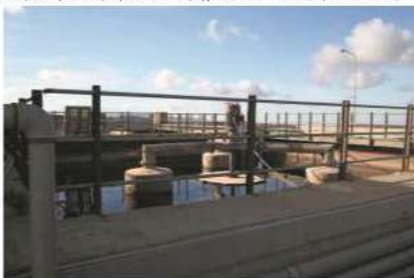
Εγκατάσταση επεξεργασίας στραγγισμάτων ΧΥΤΑ Αμαρίου (Δεκέμβριος 2017)

παράλειψη νόμιμης οικειόμενης ενέργειας (ΣτΕ 2680/2003) και ενδεχομένως παράβαση καθήκοντος, εφόσον συντρέχουν και οι λοιπές προϋποθέσεις.