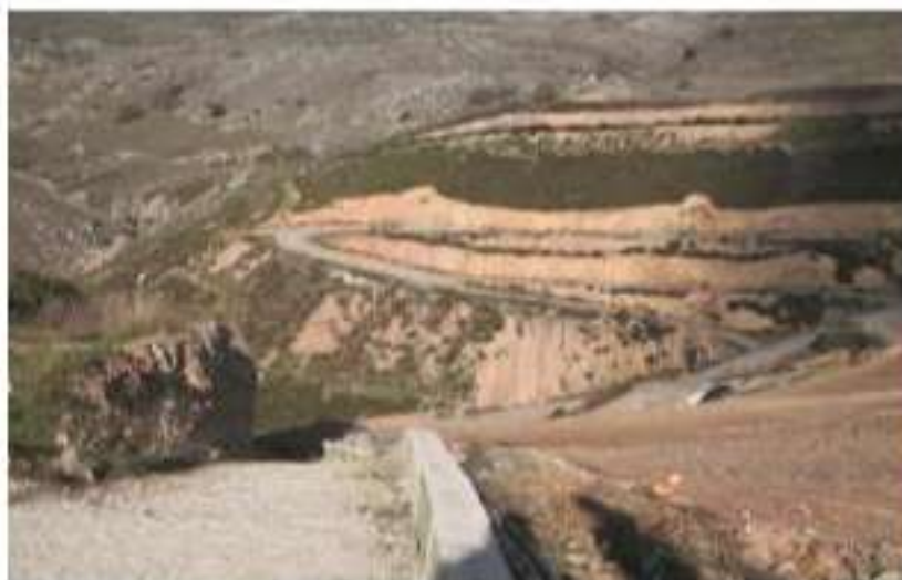
ΧΥΤΑ Αμαρίου ΠΕ Ρεθύμνης (Δεκέμβριος 2017)

Αξιολόγηση (ΕΟΑ). Ακόμα και εάν η ΕΟΑ οδηγείται σε αρνητικά συμπεράσματα της εκτίμησης των επιπτώσεων και εφόσον ένα έργο ή δραστηριότητα πρέπει να πραγματοποιηθεί για επιτακτικούς λόγους σημαντικού δημόσιου συμφέροντος, και ελλείψει εναλλακτικών λύσεων, λαμβάνεται κάθε αναγκαίο αντισταθμιστικό μέτρο ώστε να εξασφαλισθεί η προστασία της συνολικής συνοχής των περιοχών του δικτύου Natura 2000 (παρ. 4). Από τα ανωτέρω συνάγεται ότι η καθυστέρηση της σύνταξης των προβλεπόμενων Ειδικών Περιβαλλοντικών Μελετών (ΕΠΜ) και της έκδοσης των αντίστοιχων προεδρικών διαταγμάτων, οδηγούν στην ανά περίπτωση έκδοση ΕΟΑ και σε καθυστερήσεις κατά τη χωροθέτηση δραστηριοτήτων στις εν λόγω περιοχές 69 . Επίσης, εξαιτίας της παράλειψης έγκαιρης σύνταξης ΕΠΜ είναι πιθανό να τεθούν ζητήματα λόγω της ενδεχόμενης υπερσυγκέντρωσης δραστηριοτήτων και της ακόλουθης αλλοίωσης του χαρακτήρα των περιοχών. Αυτό μοιραία θα οδηγήσει στη σύνταξη ΕΠΜ, που θα εναρμονίζεται με διαμορφωμένες καταστάσεις και θα απέχει, τελικά, από αυτή της ορθολογικής προστασίας της περιοχής. Σε κάθε περίπτωση, πάντως, στο νομοθετικό πλαίσιο έχουν τεθεί τα βασικά εχέγγυα για τη διαφορετική στάθμιση των δραστηριοτήτων σε προστατευόμενες περιοχές. Με το άρθρο 44 του ν. 4685/2020, με το οποίο προβλέφθηκαν οι γενικές κατηγορίες χρήσεων εντός Natura, τα έργα διαχείρισης αποβλήτων μπορούν να ενταχθούν στη « Ζώνη βιώσιμης διαχείρισης φυσικών πόρων ».