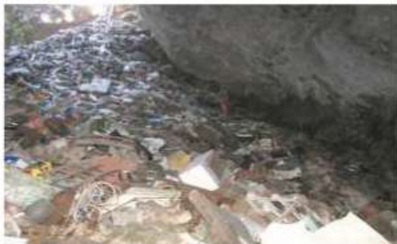
Κοινοτικός ΧΑΔΑ εντός σπηλαιοβαράθρου στον οικισμό Αγίας Άννας Βοιωτίας (Μάιος 2014)

και στην πρόκληση πυρκαγιών 50 . Επιπλέον, διαπιστώνεται ότι δεν λαμβάνονταν ούτε τα ελάχιστα μέτρα για την προστασία του περιβάλλοντος από τη λειτουργία των ΧΑΔΑ, όπως περίφραξη, κατά το δυνατόν τακτοποίηση του χώρου, προσπάθεια για την ημερήσια κάλυψη και διάσπρωση των απορριμμάτων και λήψη μέτρων πυροπροστασίας. Τέλος, έχει διαπιστωθεί η πρόκληση πυρκαγιών είτε λόγω αυτανάφλεξης είτε και λόγω υπαίτιας καύσης τους για τη μείωση του όγκου των αποβλήτων.