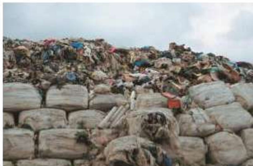
Χώρος δεματοποίησης αποβλήτων (Μάρτιος 2017)

διαλογή προς περαιτέρω επεξεργασία του βιοαποδομήσιμου κλάσματος. Συνεπώς, εν προκειμένω, η προσωρινή αποθήκευση δεν μπορεί να υπερβεί το ένα έτος.