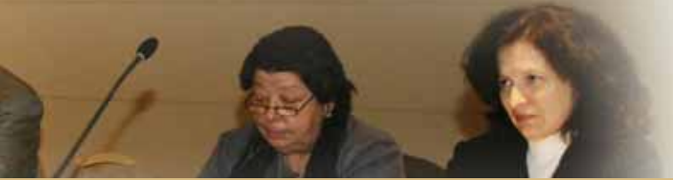
ΤΗΣ Π.Ο.Ε. - Ο.Τ.Α. - ΕΚΠΡΟΣΩΠΟΥ ΤΗΣ Δ.Α.Κ.Ε. - Ο.Τ.Α.

ηττας στις Δημοτικές Επιχειρήσεις και σαφώς εδώ έρχεται ο Κώδικας και βάζει ασφαλιστικές δικλείδες, ξεκάθαρες πλέον δικλείδες-φραγμούς όσον αφορά την επέκταση των.