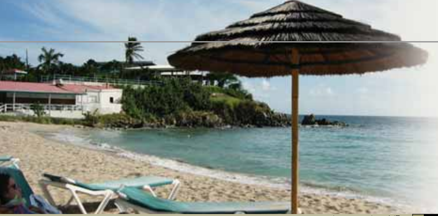
Συνέχεια από σελίδα 1

ΓΙΑ ΤΗ ΔΙΑΣΦΑΛΙΣΗ ΤΗΣ ΟΜΑΛΗΣ ΛΕΙΤΟΥΡΓΙΑΣ ΤΩΝ Ο.Τ.Α.: