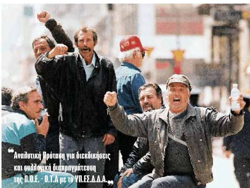
“Αναλυτική Πρόταση για διεκδικήσεις και συλλογική διαπραγμάτευση της Π.Ο.Ε. - Ο.Τ.Α με το ΥΠ.ΕΣ.Δ.Δ.Α.”

Εκτός από την αναλυτική πρόταση που δημοσιεύεται αυτούσια στη σελίδα 8, το Γενικό Συμβούλιο της Π.Ο.Ε. - Ο.Τ.Α. αποφάσισε την πραγματοποίηση περιφερειακών συσκέψεων για την παρουσίαση του προγράμματος των διεκδικήσεων του κλάδου για το 2001. Μετά τις περιφερειακές συσκέψεις, που πραγματοποιήθηκαν με μεγάλη επιτυχία και συμμετείχαν τα Διοικητικά Συμβούλια, η Ομοσπονδία κάλεσε τους συλλόγους - μέλη της να οργανώσουν Γενικές Συνελεύσεις και συγκεντρώσεις, προκειμένου να συζητηθούν οι θέσεις της Ομοσπονδίας και να εκφραστούν οι απόψεις των εργαζομένων, αλλά και να ετοιμασθεί ο κλάδος για την αγωνιστική του